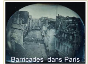
Barricades dans Paris

Pour aider les chômeurs, le gouvernement crée des ateliers nationaux mais ils coûtent cher à l'état et sont mal organisés : ils doivent fermer. Cette fermeture est à l'origine de la révolte des ouvriers en juin 1848 . Les manifestants mettent en place des barricades (construites avec les pavés des rues de Paris) pour se protéger. Le gouvernement réagit violemment : on comptera plusieurs milliers de morts parmi les insurgés (les manifestants) et les forces gouvernementales (policiers, soldats).