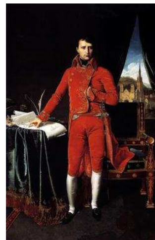
Napoléon Bonaparte dans son habit de consul (d'abord 1 er Premier Consul puis Consul à vie)